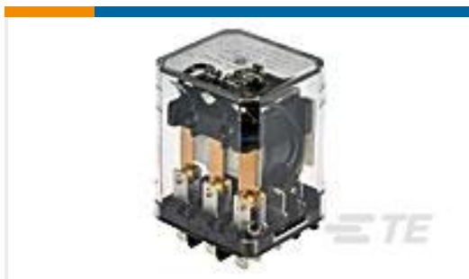
TE 产品编号5-1393117-9 KUP-11D55-48=KU