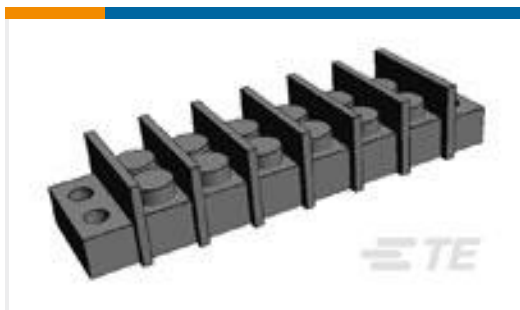
TE 产品编号1546306-6 6P .374" DR BARRIER STRIP