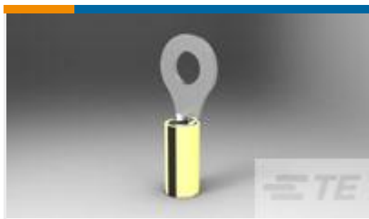
TE 产品编号327743 TERMINAL,PIDG R 16-14HD 1/4