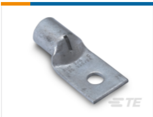
TE 产品编号325203 AMPOWER Lug Crimp Terminal, 1 Stud Hole