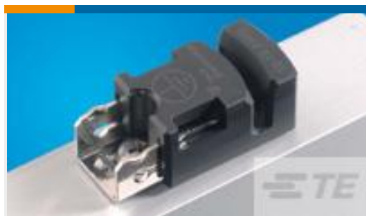
TE 产品编号1954381-2 Asy,Grounding Clip,10-12 AWG w