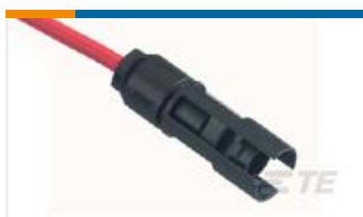
TE 产品编号6-1394461-2 PHOTOVOLT CONN PIN NEUTRAL 4 s