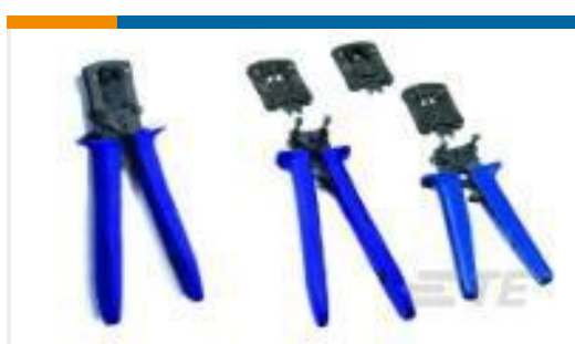
TE 产品编号1-1579004-2 CSV10 CRIMPING HANDTOOL SOLARLOK 4-6