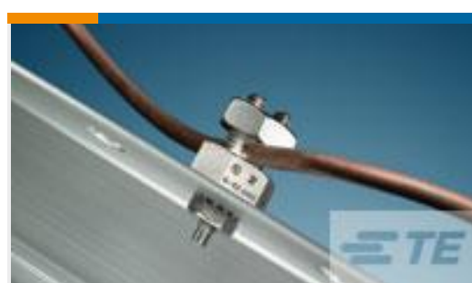
TE 产品编号2106831-1 Grounding Assy