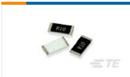
TE 产品编号2-1879462-8 RL73H 2B R22 1% 1K RL