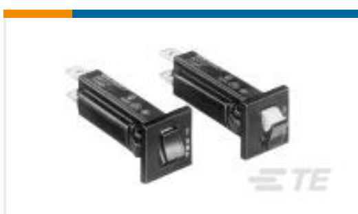
TE 产品编号1-1393250-7 W28-XQAT-15=W28