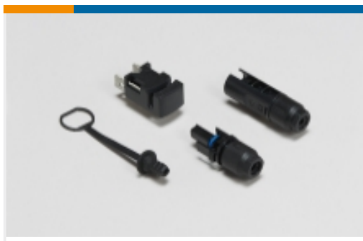
光伏连接器和适配器(35)