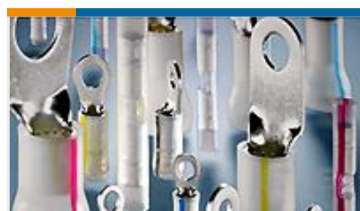
TE 产品编号53423-1 TERMINAL, PIDG PVF2 R 12-10 6