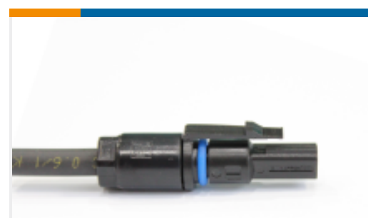
TE 产品编号1-1987559-1 PHOTOVOLTAIK CONNECTOR, 4sqmm