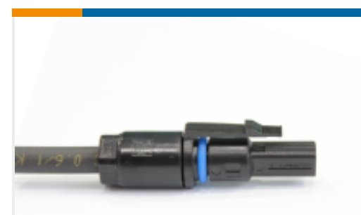
TE 产品编号1-1987559-2 PHOTOVOLTAIK CONNECTOR, 4sqmm