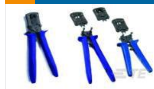
TE 产品编号1-1579004-2 CSV10 CRIMPING HANDTOOL SOLARLOK 4-6