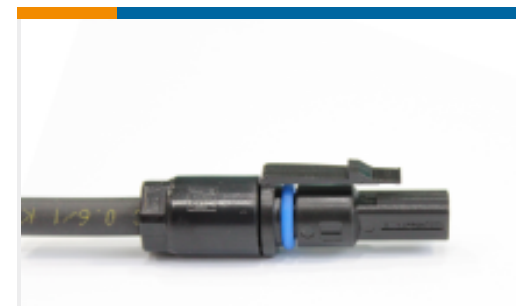
TE 产品编号1-1987559-2 PHOTOVOLTAIK CONNECTOR, 4sqmm