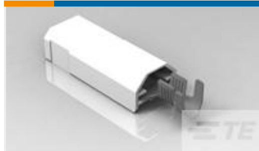
TE 产品编号521227-2 ULTRA-POD 250 ASSY TAB 12-10 AWG TPBR