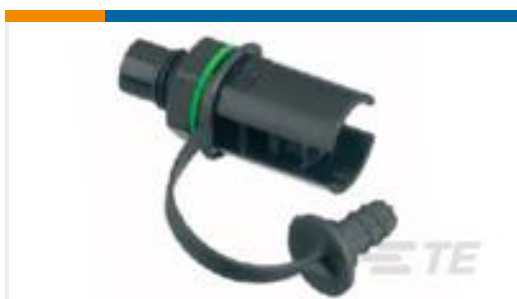
TE 产品编号1394739-1 STECKVERB.ABDECKUNG