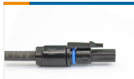
TE 产品编号1-1987559-1 PHOTOVOLTAIK CONNECTOR, 4sqmm