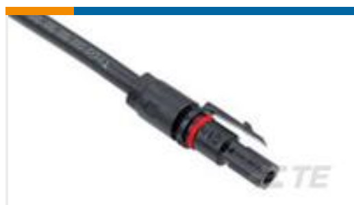
TE 产品编号1987559-1 PHOTOVOLTAIK CONNECTOR, 2.5 sqmm