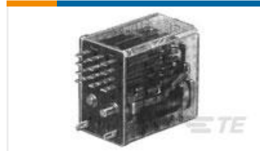
TE 产品编号1393766-3 R10-E1X2-S800=R10