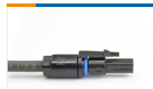
TE 产品编号1-1987559-2 PHOTOVOLTAIK CONNECTOR, 4sqmm