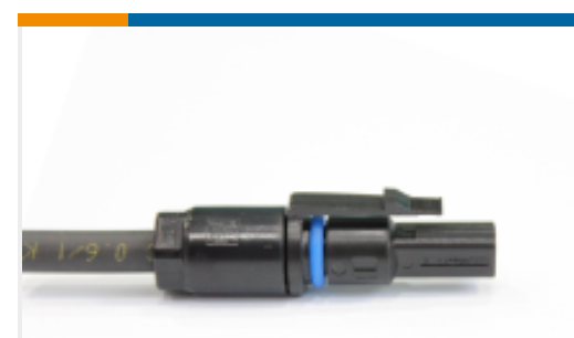
TE 产品编号1-1987559-1 PHOTOVOLTAIK CONNECTOR, 4sqmm