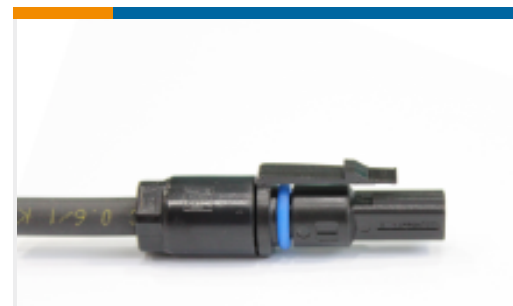
TE 产品编号1-1987559-1 PHOTOVOLTAIK CONNECTOR, 4sqmm