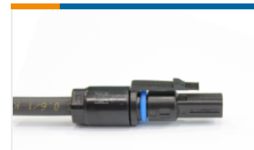
TE 产品编号1-1987559-2 PHOTOVOLTAIK CONNECTOR, 4sqmm