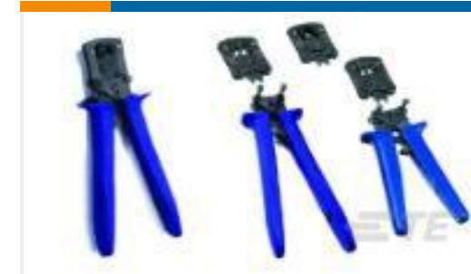
TE 产品编号1-1579004-2 CSV10 CRIMPING HANDTOOL SOLARLOK 4-6