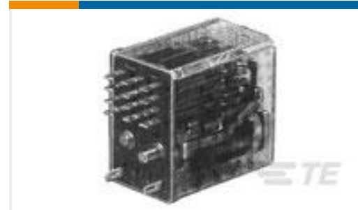
TE 产品编号1393766-3 R10-E1X2-S800=R10