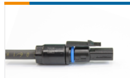
TE 产品编号1-1987559-2 PHOTOVOLTAIK CONNECTOR, 4sqmm