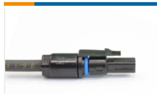
TE 产品编号1-1987559-1 PHOTOVOLTAIK CONNECTOR, 4sqmm