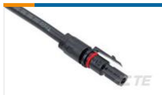
TE 产品编号1987559-1 PHOTOVOLTAIK CONNECTOR, 2.5 sqmm