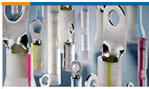
TE 产品编号53423-1 TERMINAL,PIDG PVF2 R 12-10 6