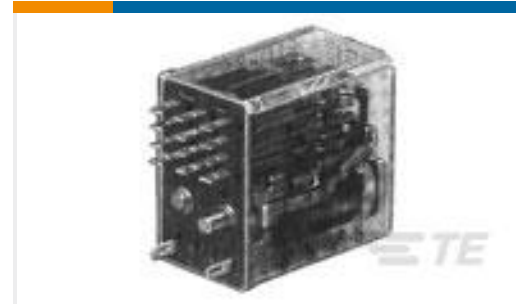
TE 产品编号1393766-3 R10-E1X2-S800=R10