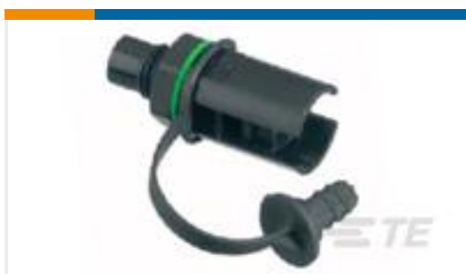
TE 产品编号1394739-1 STECKVERB.ABDECKUNG