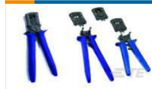
TE 产品编号1-1579004-2 CSV10 CRIMPING HANDTOOL SOLARLOK 4-6