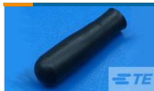
TE 产品编号610015-000 D-300-02