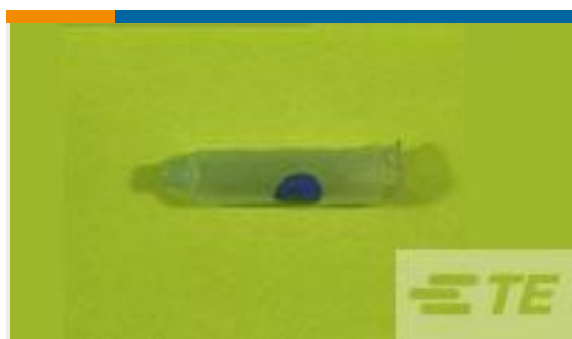
TE 产品编号617867-000 D-436-0186