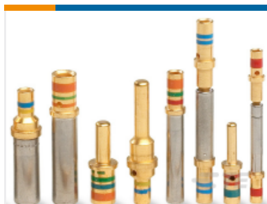
TE 产品编号2562-209-2031 CONT SOC ASSY