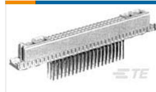
TE 产品编号5148420-5 ASSY,RECPT,TYPE M,EUROCARD,L-F