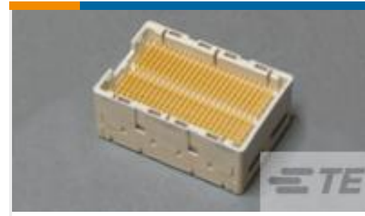
TE 产品编号6-1761614-5 STEP-Z PLUG 15MM 200P LF ST