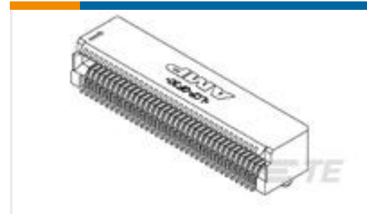
TE 产品编号1367337-2 70 POS PT CONNECTOR, X2, XENPAK, 30 AU