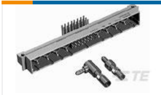
TE 产品编号5148414-5 ASSY,PIN,R.A.,TYPE M,EUROCARD,L-FREE,24+