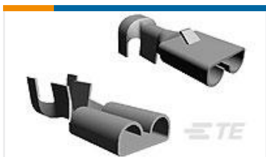
TE 产品编号1217150-1 FF 187 REC 18-14AWG TPBR