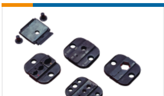
TE 产品编号58545-3 SDE DIE ASSY. 22-10 SOLISTRAND