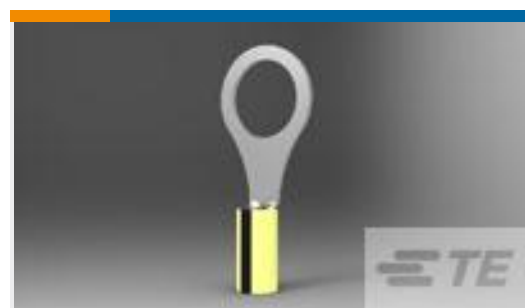
TE 产品编号330896-2 PIDG 16-14 HD R 3/8, TAPE