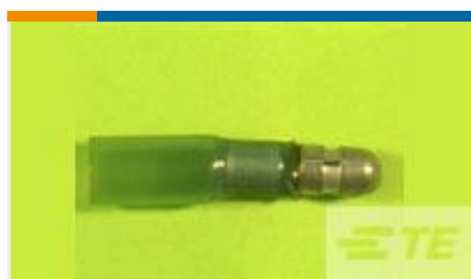
TE 产品编号908701-000 B-106-7502