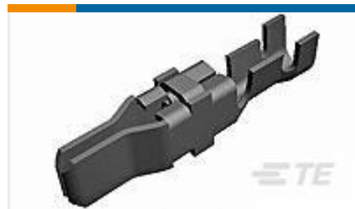
TE 产品编号1-66255-1 MALE CONTACT ASSY. (STRIP)