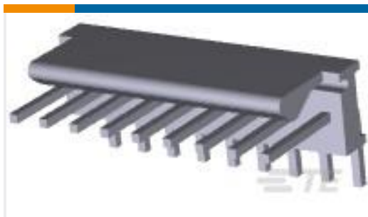
TE 产品编号640457-9 09P MTA100 HDR ASSY SQ R/A F/L