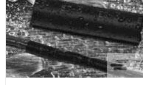
TE 产品编号121397P013 ES2000-NO.3-B8-0-41MM