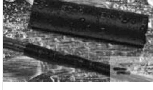
TE 产品编号CX2740-000 ES2000-NO.3-B8-0-130MM