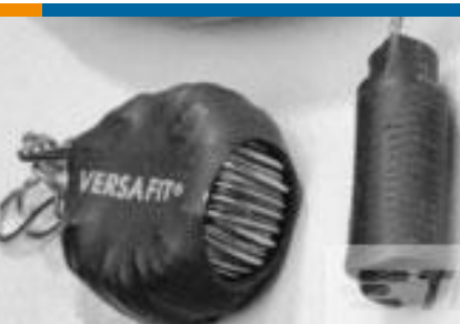
TE 产品编号CZ8200-000 VERSAFIT-3/4-0-2.25IN