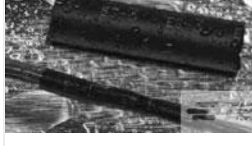
TE 产品编号CX2740-000 ES2000-NO.3-B8-0-130MM