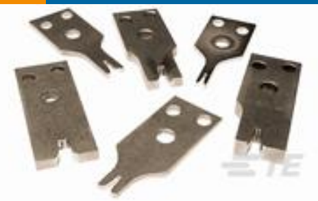
TE 产品编号6-1424909-6 CRIMPER, INSULATION "F"(.240")