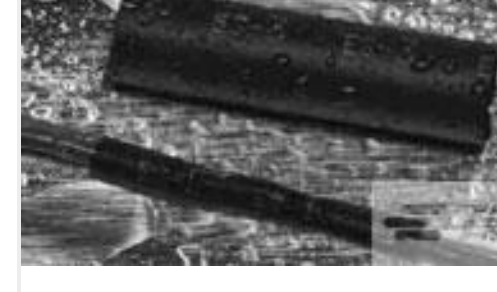
TE 产品编号121397P013 ES2000-NO.3-B8-0-41MM