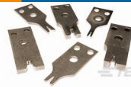
TE 产品编号6-456134-7 CRIMPER, INSULATION "F"(.210")