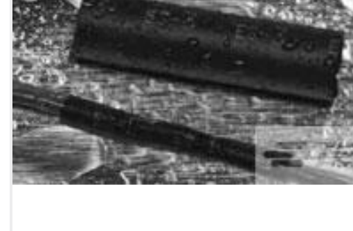
TE 产品编号121397P013 ES2000-NO.3-B8-0-41MM