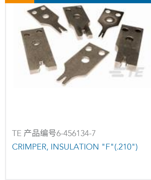
TE 产品编号6-456134-7 CRIMPER, INSULATION "F"(.210")