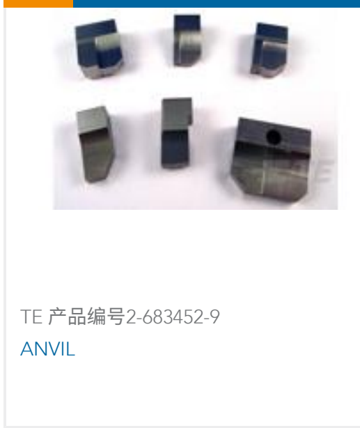
TE 产品编号2-683452-9 ANVIL