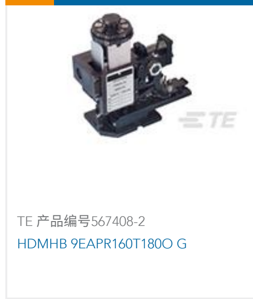
TE 产品编号567408-2 HDMHB 9EAPR160T180O G