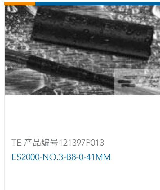
TE 产品编号121397P013 ES2000-NO.3-B8-0-41MM