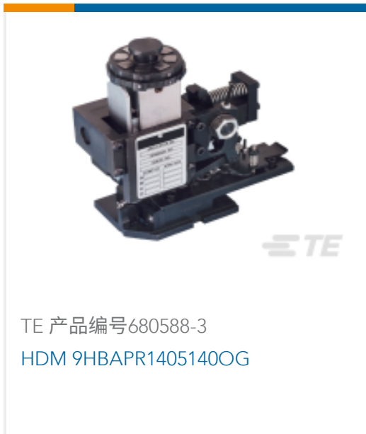
TE 产品编号680588-3 HDM 9HBAPR1405140OG