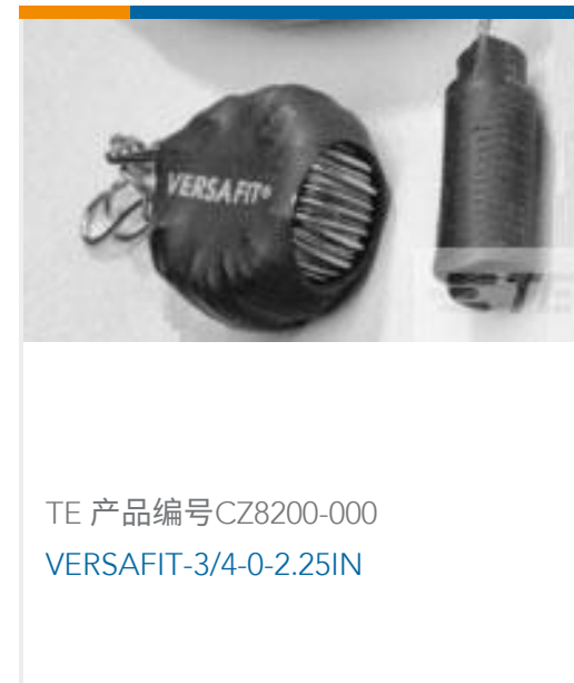
TE 产品编号CZ8200-000 VERSAFIT-3/4-0-2.25IN