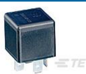
TE 产品编号6-1393302-0 V23134A1052X294-EV-CBOX