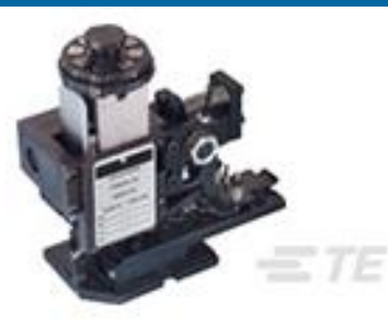
TE 产品编号1855686-1 HDM-FA-EA-280F310F-LM & BENCH G-CUT