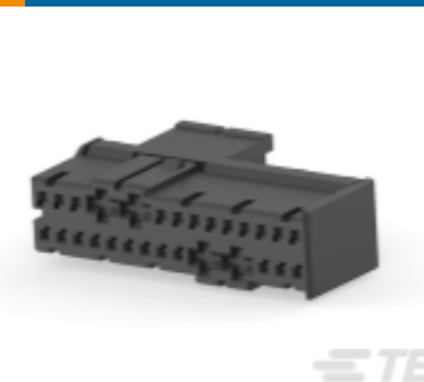
TE 产品编号929061-1 JPT/MOD4 GEH 28P