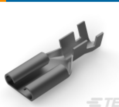
TE 产品编号881606-4 FASTIN-ON .375 REC