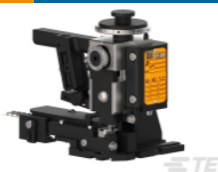
TE 产品编号2266765-1 OCEAN-2.0-APPLICATOR-S-092F150O