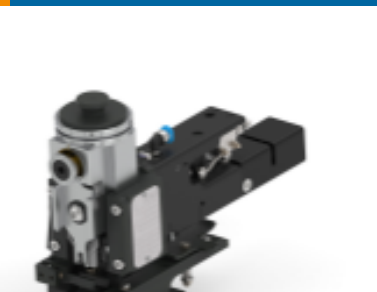
TE 产品编号2150569-1 OCEAN_2.0_Applicator-E-070F