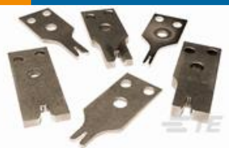
TE 产品编号6-1424909-6 CRIMPER, INSULATION "F"(.240")