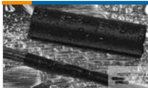
TE 产品编号CX2740-000 ES2000-NO.3-B8-0-130MM