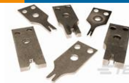
TE 产品编号6-456134-7 CRIMPER, INSULATION "F"(.210")