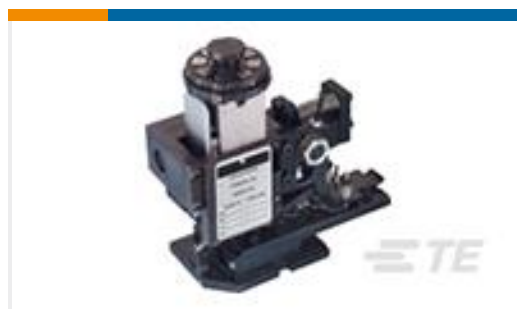
TE 产品编号567408-2 HDMHB 9EAPR160T180O G