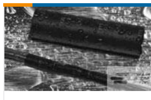
TE 产品编号121397P013 ES2000-NO.3-B8-0-41MM