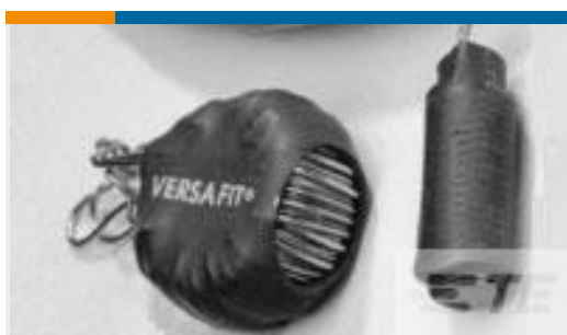
TE 产品编号CZ8200-000 VERSAFIT-3/4-0-2.25IN