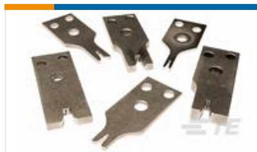
TE 产品编号6-1424909-6 CRIMPER, INSULATION "F"(.240")