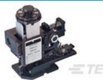
TE 产品编号567408-2 HDMHB 9EAPR160T180O G