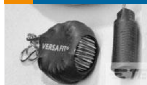
TE 产品编号CZ8200-000 VERSAFIT-3/4-0-2.25IN