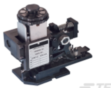
TE 产品编号680588-3 HDM 9HBAPR1405140OG