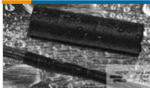
TE 产品编号121397P013 ES2000-NO.3-B8-0-41MM