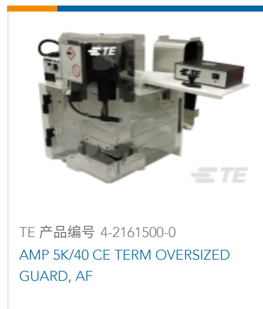
TE 产品编号 4-2161500-0 AMP 5K/40 CE TERM OVERSIZED GUARD, AF