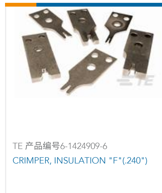
TE 产品编号 6-1424909-6 CRIMPER, INSULATION "F"(.240")