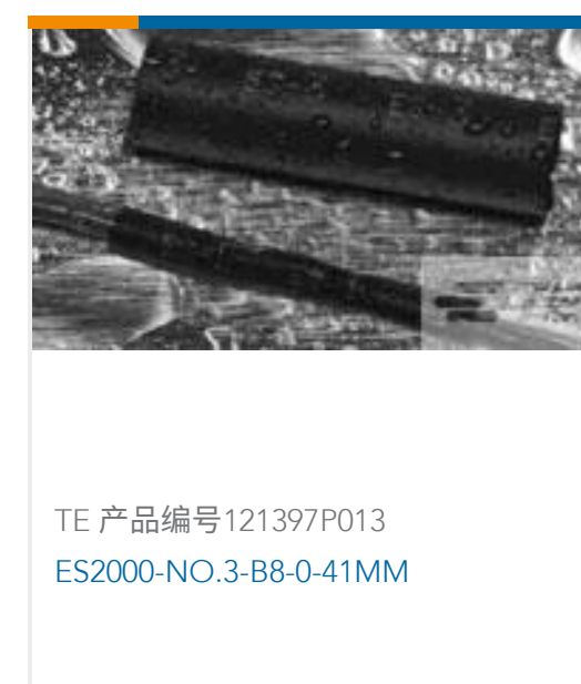
TE 产品编号 121397P013 ES2000-NO.3-B8-0-41MM