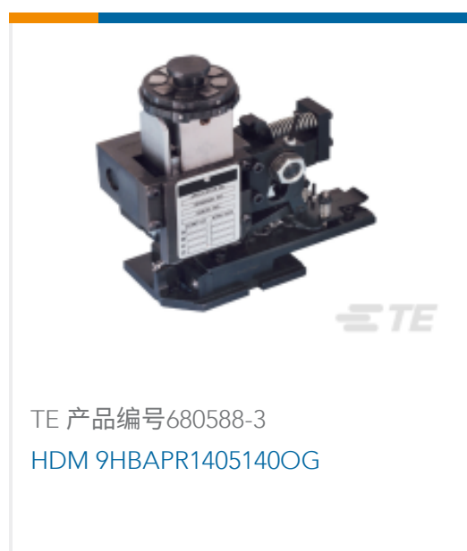
TE 产品编号 680588-3 HDM 9HBAPR1405140OG