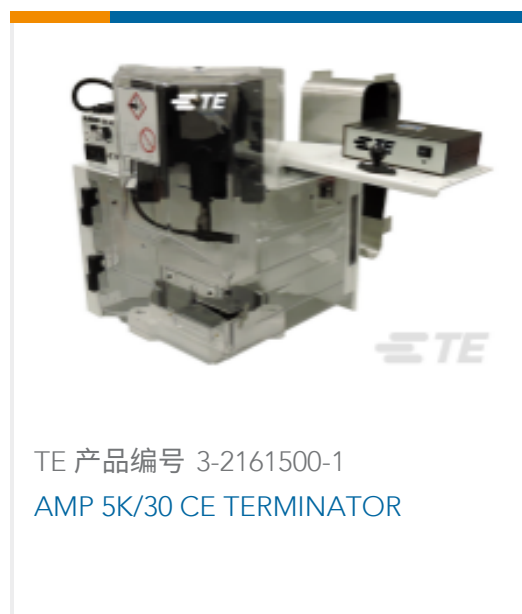
TE 产品编号 3-2161500-1 AMP 5K/30 CE TERMINATOR