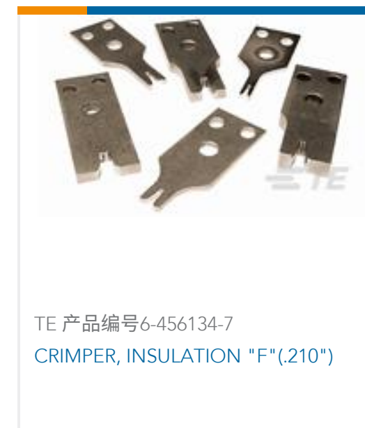
TE 产品编号 6-456134-7 CRIMPER, INSULATION "F"(.210")