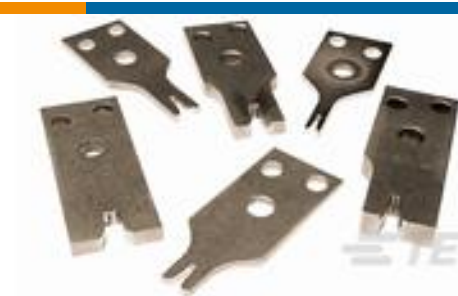
TE 产品编号6-456134-7 CRIMPER, INSULATION "F"(.210")