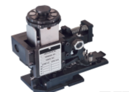
TE 产品编号680588-3 HDM 9HBAPR1405140OG