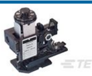
TE 产品编号567408-2 HDMHB 9EAPR160T180O G