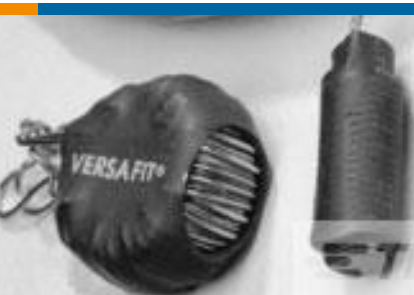
TE 产品编号CZ8200-000 VERSAFIT-3/4-0-2.25IN