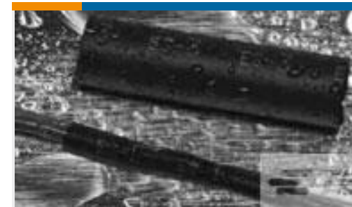
TE 产品编号121397P013 ES2000-NO.3-B8-0-41MM