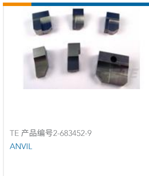
TE 产品编号 2-683452-9 ANVIL