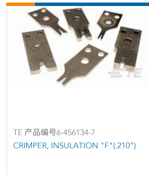
TE 产品编号 6-456134-7 CRIMPER, INSULATION "F"(.210")