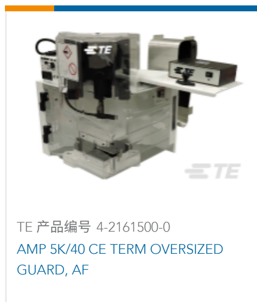
TE 产品编号 4-2161500-0 AMP 5K/40 CE TERM OVERSIZED GUARD, AF