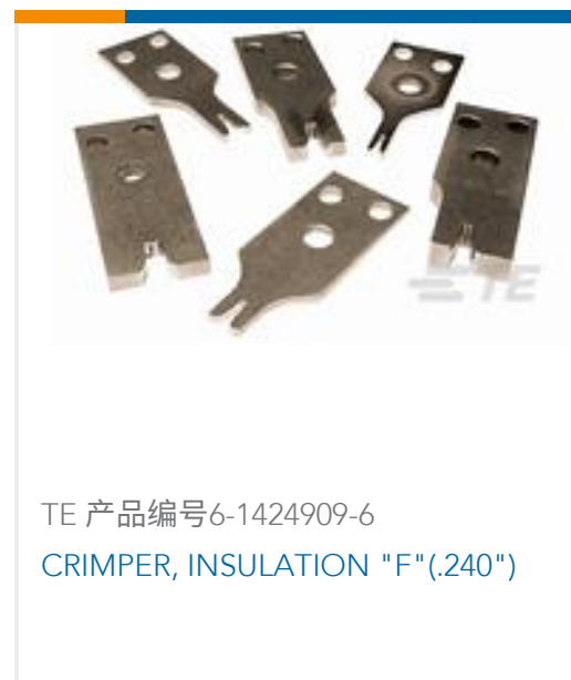
TE 产品编号 6-1424909-6 CRIMPER, INSULATION "F"(.240")