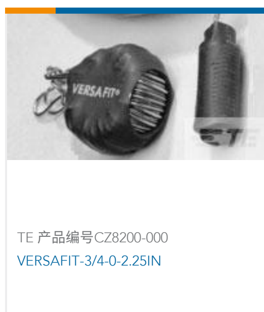
TE 产品编号 CZ8200-000 VERSAFIT-3/4-0-2.25IN