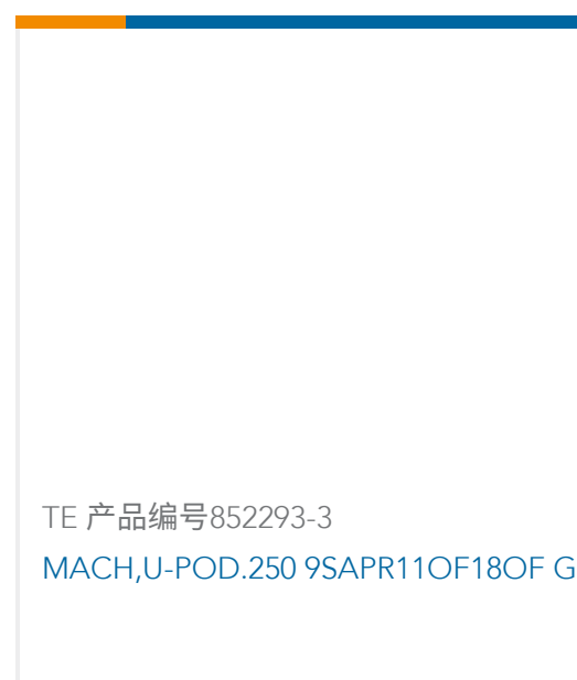
TE 产品编号 852293-3 MACH,U-POD.250 9SAPR11OF18OF G