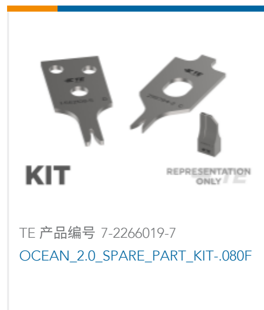
TE 产品编号 7-2266019-7 OCEAN_2.0_SPARE_PART_KIT-080F