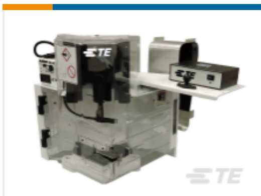
TE 产品编号 2161500-2 AMP 5K/40 CE TERMINATOR, W/COM