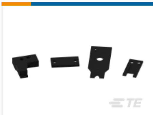
TE 产品编号 2119806-1 INSERT, SHEAR