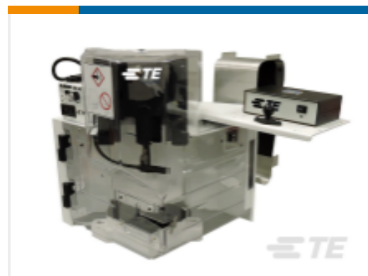
TE 产品编号 3-2161500-1 AMP 5K/30 CE TERMINATOR