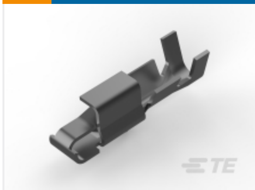
TE 产品编号 CAT-103156-WTBCC Connector Contacts: Wire-to-Board Socket, SL 156