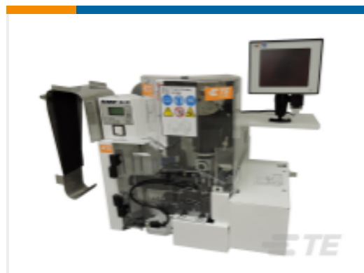
TE 产品编号 2161700-5 5K CE STRIPPING MODULE W/ COM