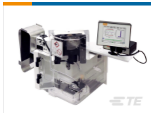
TE 产品编号 2161400-5 AMP 3K/40 CE EL TERMINATOR