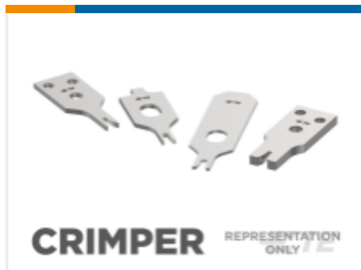
TE 产品编号 1-1633961-1 CRIMPER, INSULATION F PREMIUM