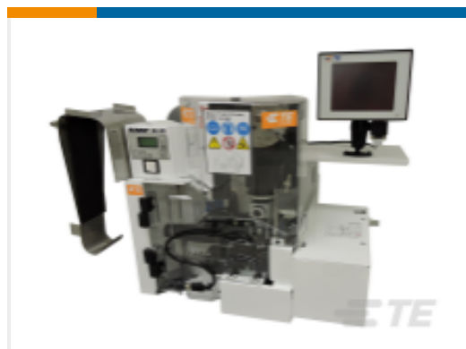
TE 产品编号 2161700-4 5K CE STRIPPING MODULE