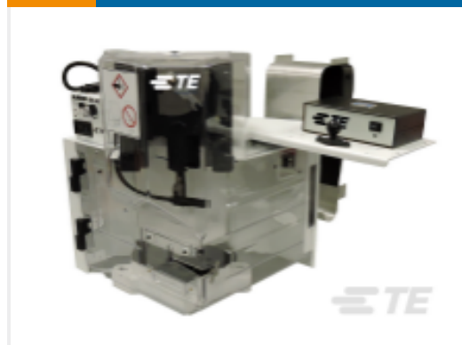
TE 产品编号 2161500-1 AMP 5K/40 CE TERMINATOR