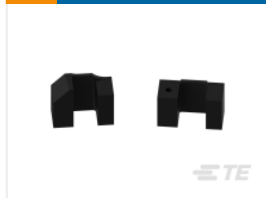
TE 产品编号 2119805-1 SHEAR HOLDER, FRONT, CUT