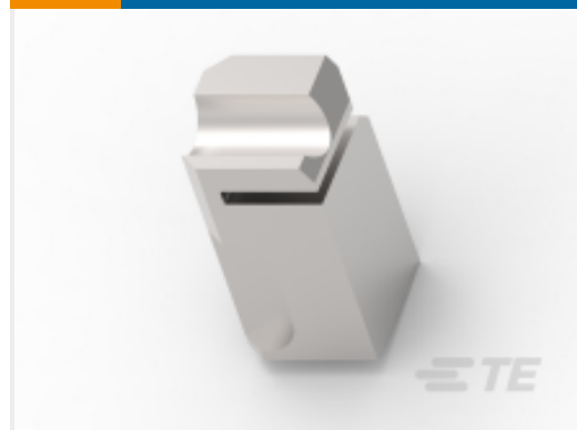
TE 产品编号 462006-6 FLOATING SHEAR