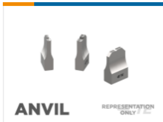
TE 产品编号 1633921-8 ANVIL, COMBINATION