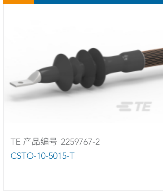
TE 产品编号 2259767-2 CSTO-10-5015-T