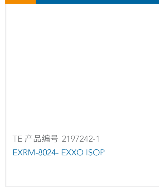
TE 产品编号 2197242-1 EXRM-8024- EXXO ISOP