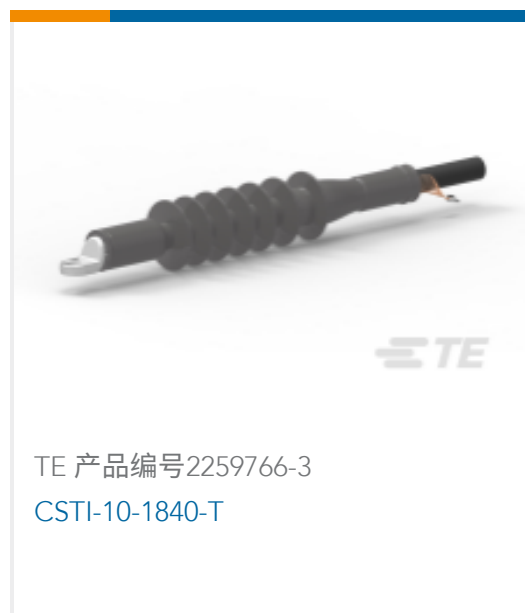
TE 产品编号2259766-3 CSTI-10-1840-T