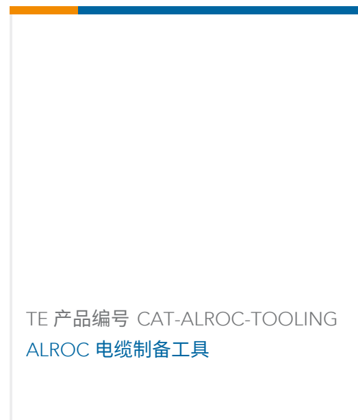
TE 产品编号 CAT-ALROC-TOOLING ALROC 电缆制备工具