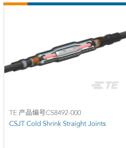
TE 产品编号CS8492-000 CSJT Cold Shrink Straight Joints