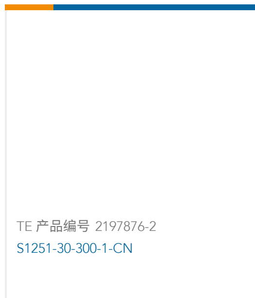
TE 产品编号 2197876-2 S1251-30-300-1-CN