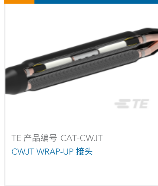
TE 产品编号 CAT-CWJT CWJT WRAP-UP 接头