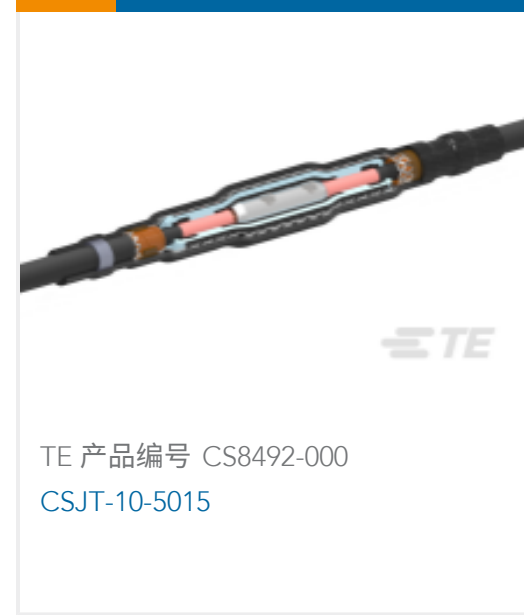
TE 产品编号 CS8492-000 CSJT-10-5015