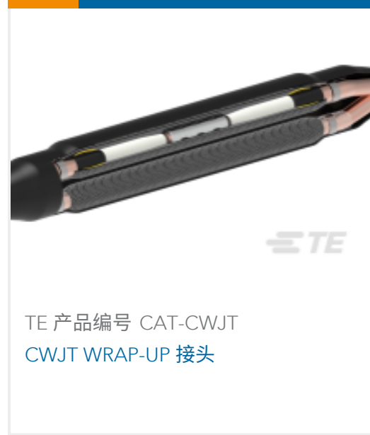
TE 产品编号 CAT-CWJT CWJT WRAP-UP 接头