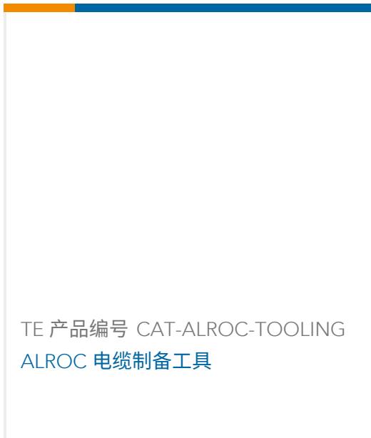
TE 产品编号 CAT-ALROC-TOOLING ALROC 电缆制备工具