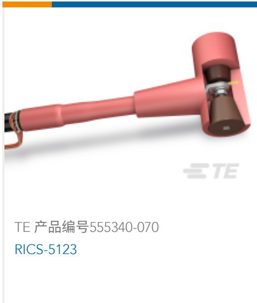
TE 产品编号555340-070 RICS-5123