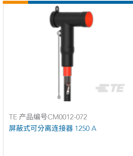
TE 产品编号CM0012-072 屏蔽式可分离连接器 1250 A