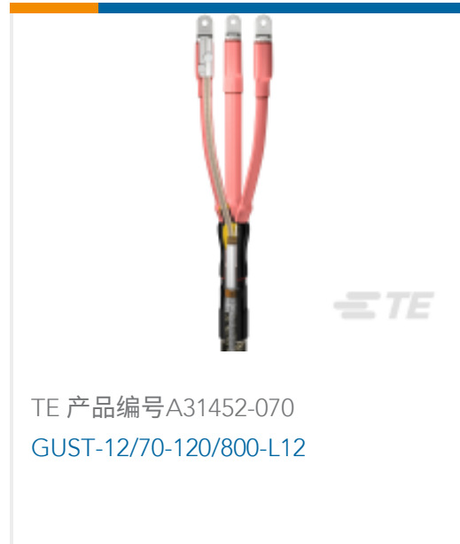
TE 产品编号A31452-070 GUST-12/70-120/800-L12