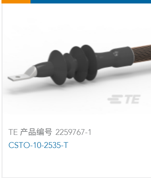
TE 产品编号 2259767-1 CSTO-10-2535-T