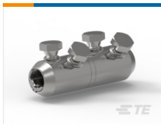
TE 产品编号1974130-1 修剪螺栓连接器高达 35 kV