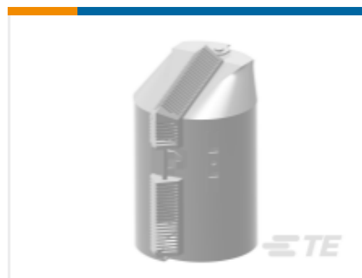
TE 产品编号A90301-000 BCAC-G-5D/8-01(B12)