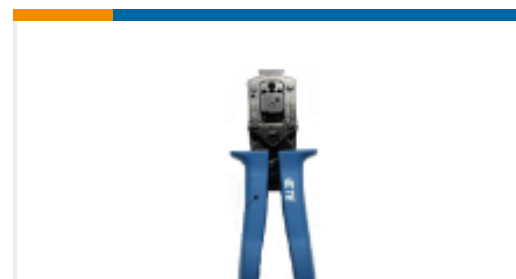
TE 产品编号2255144-1 MINI SAHT D2000-M