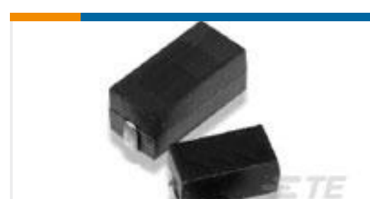
TE 产品编号3-1879233-5 SMW5 2R7 5%