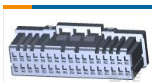
TE 产品编号1-1827863-7 DYNAMIC 1100D REC HSG X 34P BLACK