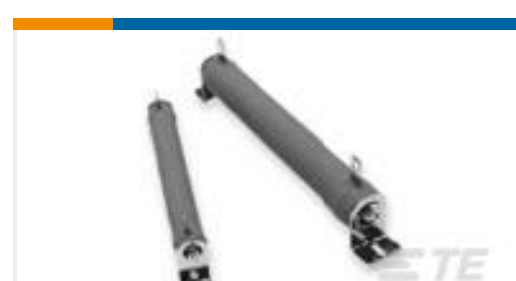
TE 产品编号1879456-1 TE 2000W 1R0 5% Bracket