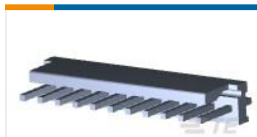
TE 产品编号4-641208-1 11P MTA156 HDR ASSY FL ST LF