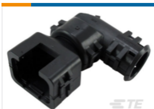
TE 产品编号2302494-1 SOC CONN CVRASSY,2POS, AMPSEAL16,90DEG,MC