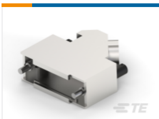
TE 产品编号4-1478763-6 METAL BACKSHELL 15 WAY 45 DEGR