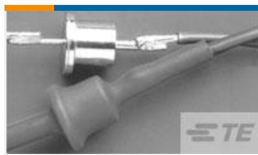
TE 产品编号1387474003 RNF-3000-39/13-8-SP