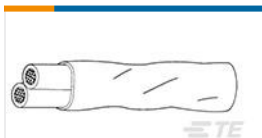
TE 产品编号3825153001 44A4121-24-0/9-9