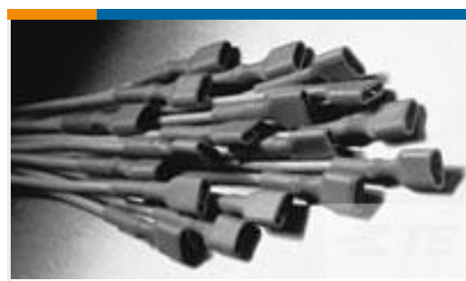
TE 产品编号9283774001 LSTT-3.2-2-SP