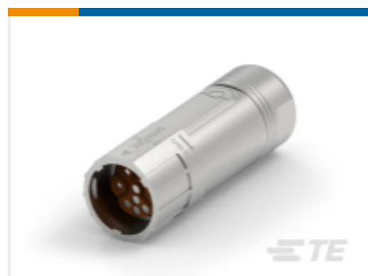
TE 产品编号BSA082N00420100000 923 PLUG, SPEEDTEC