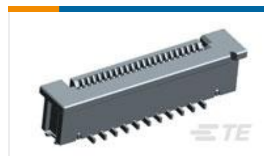
TE 产品编号 1734742-8 .5 FPC VT ZIF Type-A 8 CONT