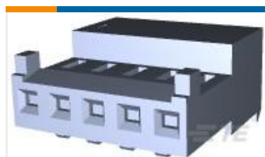
TE 产品编号 3-643813-5 05P MTA100 CONN ASSY POL RIB