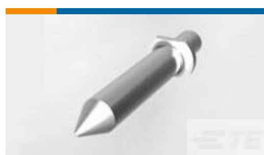
TE 产品编号 223956-1 STV ERMZUB FUEHRUNGSBOLZEN J * M 1 ***