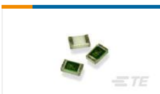
TE 产品编号 7-1879208-3 CPF 0402 10K 0.1% 25PPM 1K RL