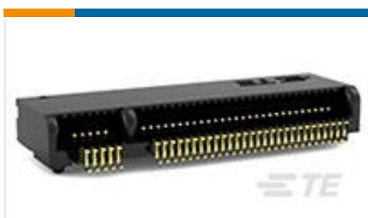
TE 产品编号 2199119-5 M.2 0.5PITCH 3.2H KEY B 30U" AU