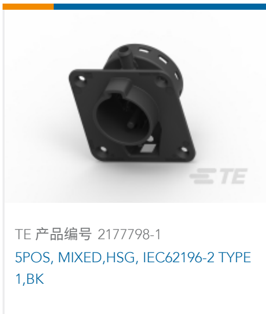
TE 产品编号 2177798-1 5POS, MIXED, HSG, IEC62196-2 TYPE 1, BK