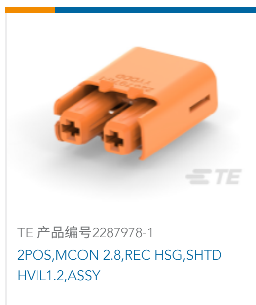
TE 产品编号2287978-1 2POS, MCON 2.8, REC HSG, SHTD HVIL1.2, ASSY