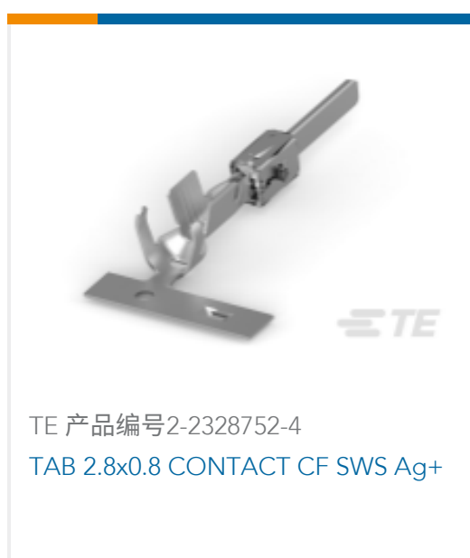
TE 产品编号2-2328752-4 TAB 2.8x0.8 CONTACT CF SWS Ag+