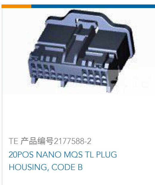
TE 产品编号2177588-2 20POS NANO MQS TL PLUG HOUSING, CODE B