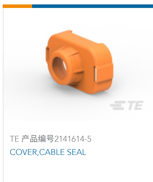
TE 产品编号2141614-5 COVER, CABLE SEAL