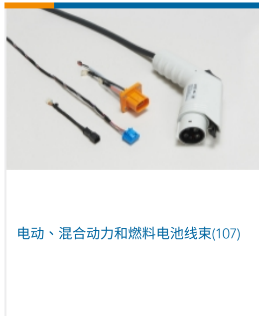
电动、混合动力和燃料电池线束(107)