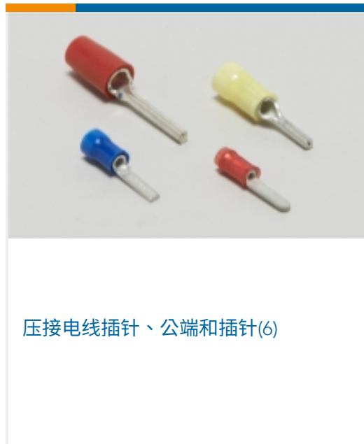
压接电线插针、公端和插针(6)