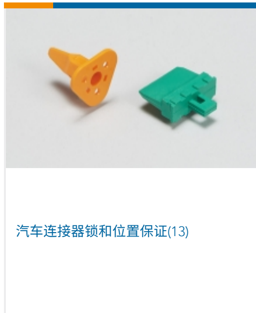
汽车连接器锁和位置保证(13)