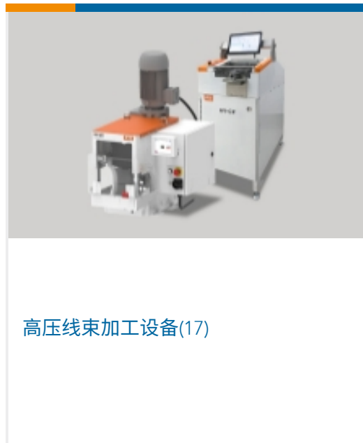
高压线束加工设备(17)