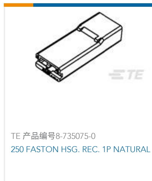
TE 产品编号8-735075-0 250 FASTON HSG. REC. 1P NATURAL