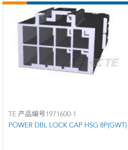
TE 产品编号1971600-1 POWER DBL LOCK CAP HSG 8P(GWT)