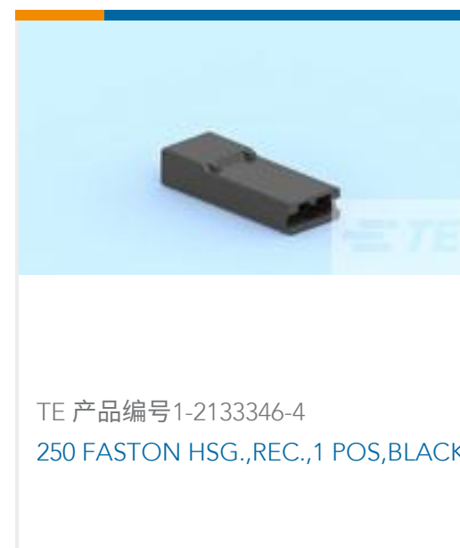
TE 产品编号1-2133346-4 250 FASTON HSG.,REC.,1 POS,BLACK