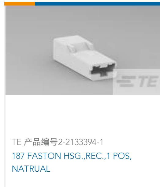
TE 产品编号2-2133394-1 187 FASTON HSG.,REC.,1 POS, NATURAL