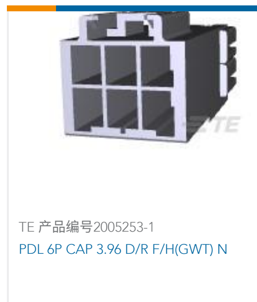
TE 产品编号2005253-1 PDL 6P CAP 3.96 D/R F/H(GWT) N