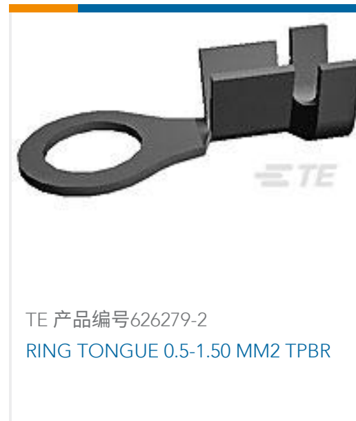
TE 产品编号626279-2 RING TONGUE 0.5-1.50 MM2 TPBR