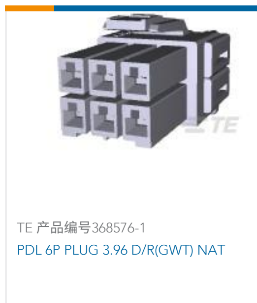
TE 产品编号368576-1 PDL 6P PLUG 3.96 D/R(GWT) NAT