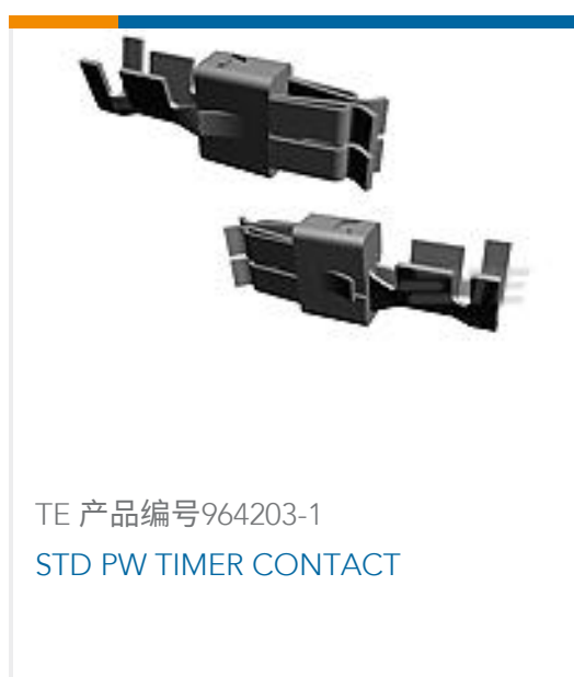
TE 产品编号964203-1 STD PW TIMER CONTACT