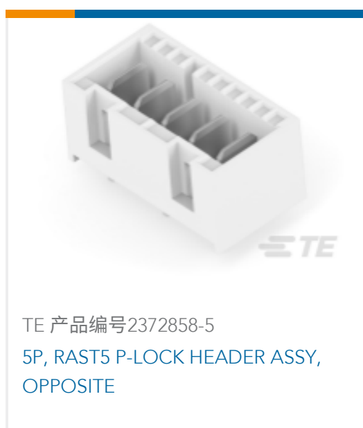
TE 产品编号2372858-5 5P, RAST5 P-LOCK HEADER ASSY, OPPOSITE