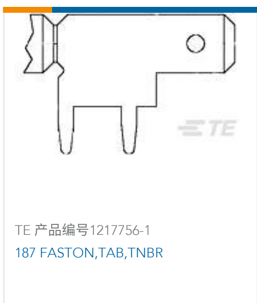
TE 产品编号1217756-1 187 FASTON,TAB,TNBR