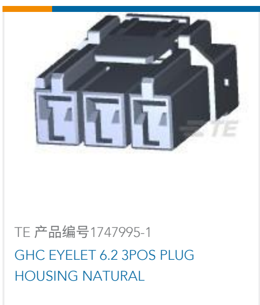
TE 产品编号1747995-1 GHC EYELET 6.2 3POS PLUG HOUSING NATURAL