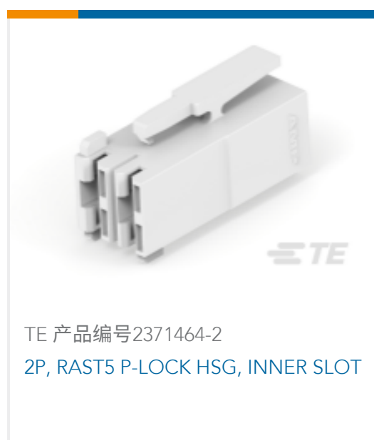
TE 产品编号2371464-2 2P, RAST5 P-LOCK HSG, INNER SLOT