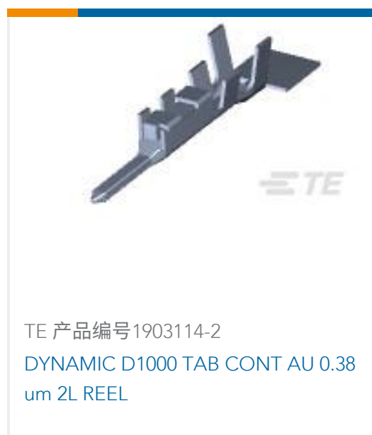
TE 产品编号1903114-2 DYNAMIC D1000 TAB CONT AU 0.38 um 2L REEL