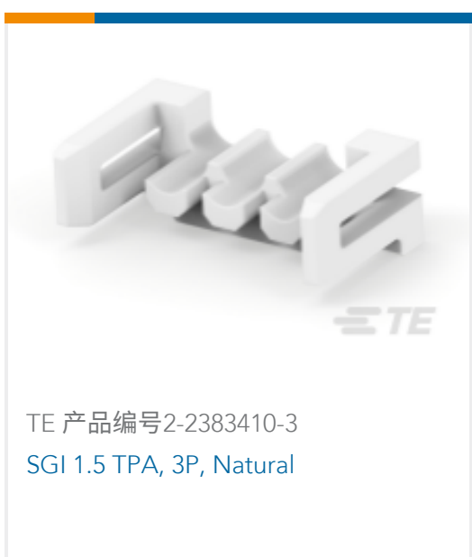
TE 产品编号2-2383410-3 SGI 1.5 TPA, 3P, Natural