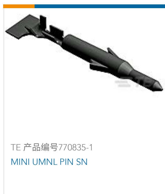
TE 产品编号770835-1 MINI UMNL PIN SN