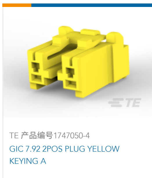
TE 产品编号1747050-4 GIC 7.92 2POS PLUG YELLOW KEYING A