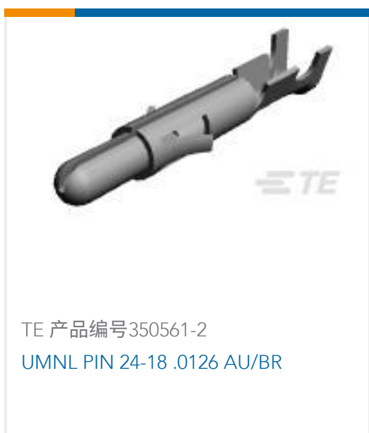
TE 产品编号350561-2 UMNL PIN 24-18 .0126 AU/BR