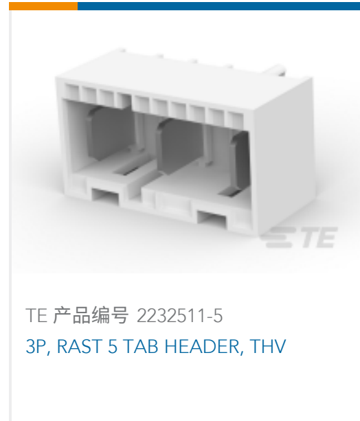
TE 产品编号 2232511-5 3P, RAST 5 TAB HEADER, THV