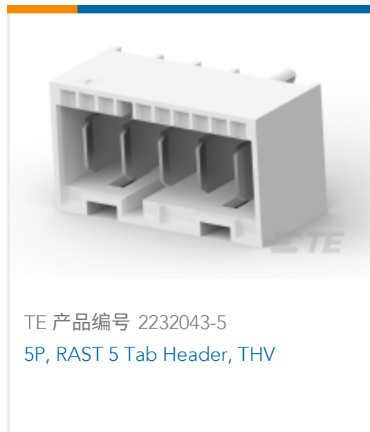
TE 产品编号 2232043-5 5P, RAST 5 Tab Header, THV