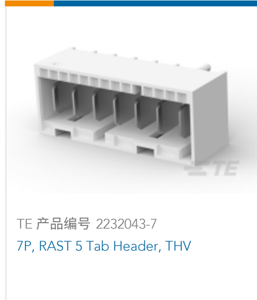
TE 产品编号 2232043-7 7P, RAST 5 Tab Header, THV