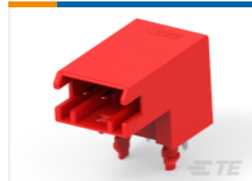
TE 产品编号1-2368182-3 RA SMC2.5 Potting HDR_RED_3P