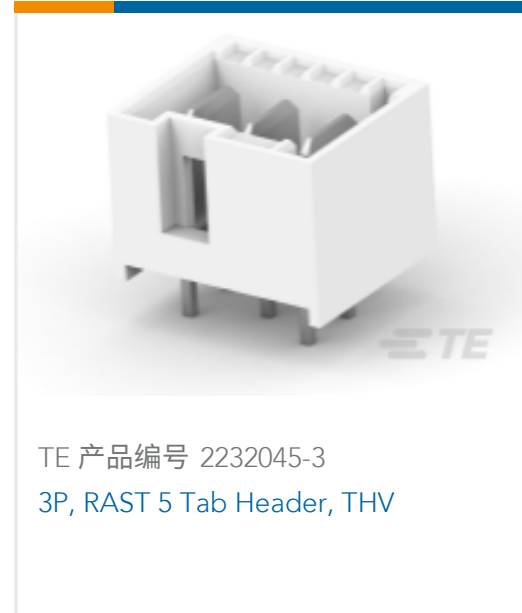
TE 产品编号 2232045-3 3P, RAST 5 Tab Header, THV