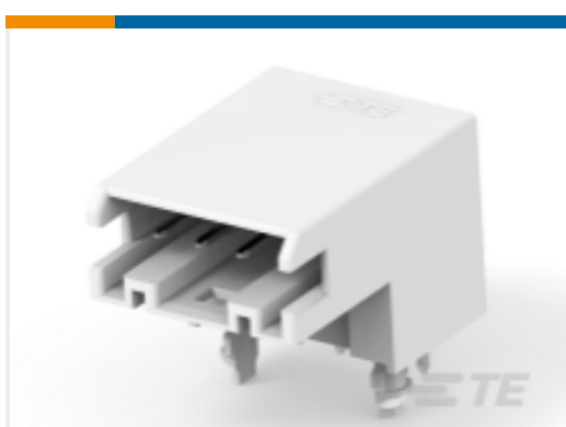
TE 产品编号2368182-4 RA SMC2.5 Potting header_4P