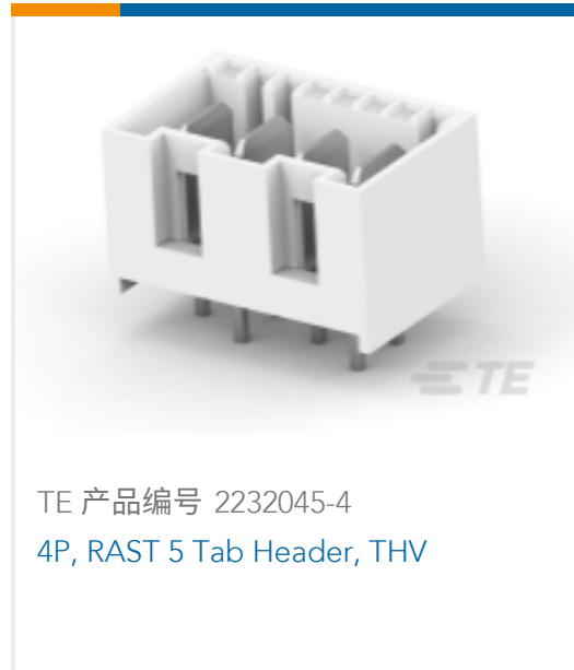
TE 产品编号 2232045-4 4P, RAST 5 Tab Header, THV