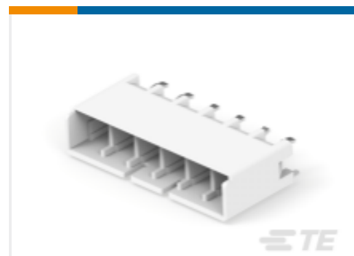
TE 产品编号6-1376385-1 B-T-W CONN. 6P HDR ASSEMBL- WITHOUT PIN2