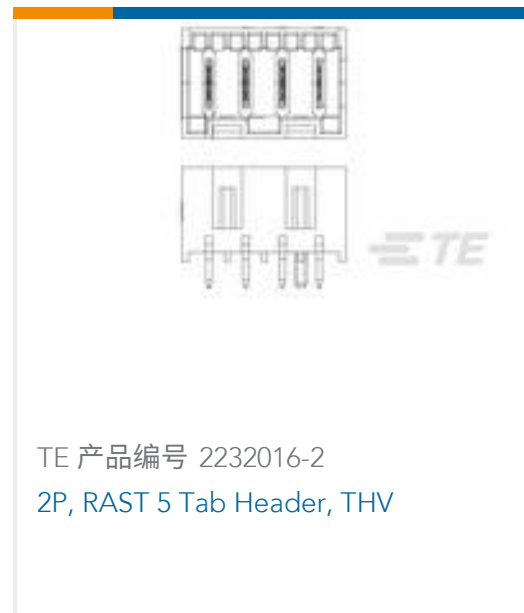
TE 产品编号 2232016-2 2P, RAST 5 Tab Header, THV