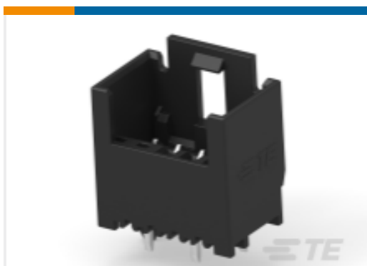
TE 产品编号2-2232960-4 4P POTTED RAST 2.5 HEADER