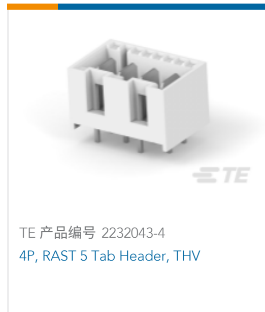
TE 产品编号 2232043-4 4P, RAST 5 Tab Header, THV