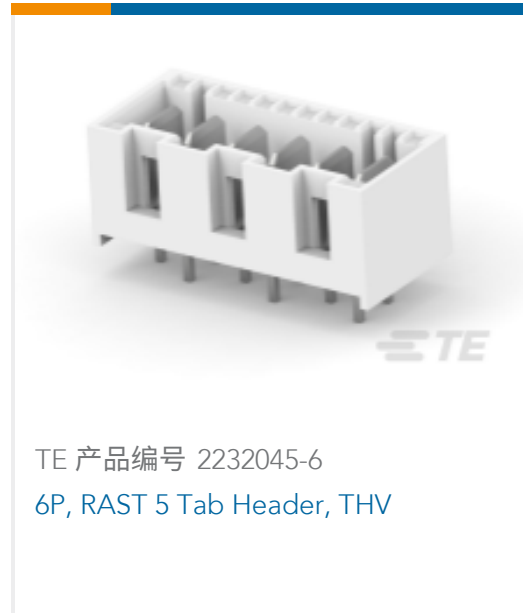
TE 产品编号 2232045-6 6P, RAST 5 Tab Header, THV