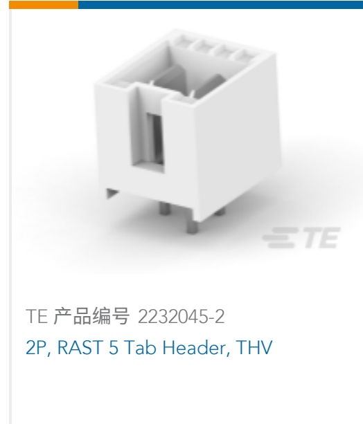
TE 产品编号 2232045-2 2P, RAST 5 Tab Header, THV