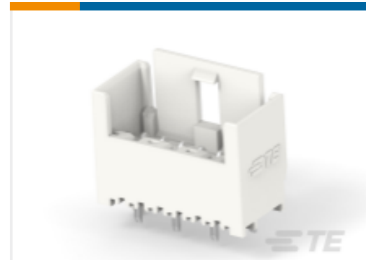
TE 产品编号1-2232960-6 6P POTTED RAST 2.5 HEADER