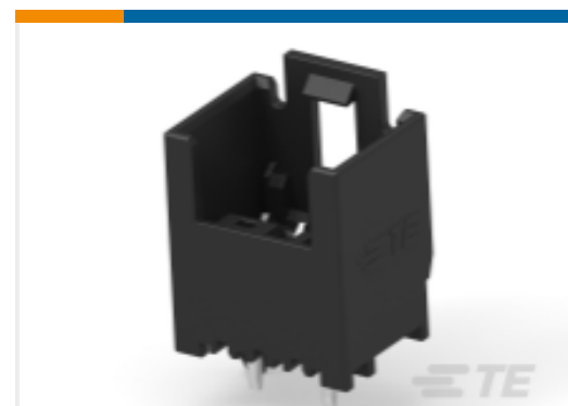
TE 产品编号3-2232960-3 3P POTTED RAST 2.5 HEADER