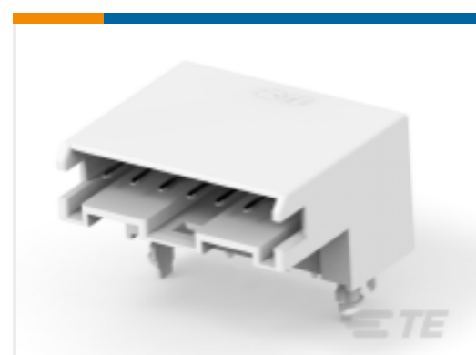
TE 产品编号2368182-7 RA SMC2.5 Potting header_7P