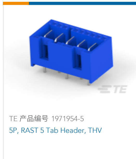
TE 产品编号 1971954-5 5P, RAST 5 Tab Header, THV