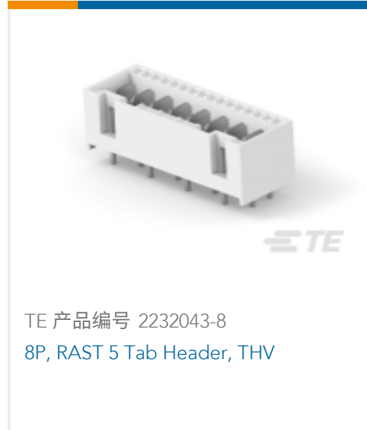
TE 产品编号 2232043-8 8P, RAST 5 Tab Header, THV