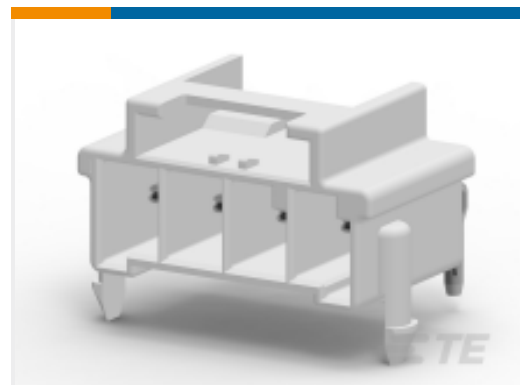
TE 产品编号1-1969694-4 PTL 1X4 PCB HEADER R/A HITEMP KEY A LGR