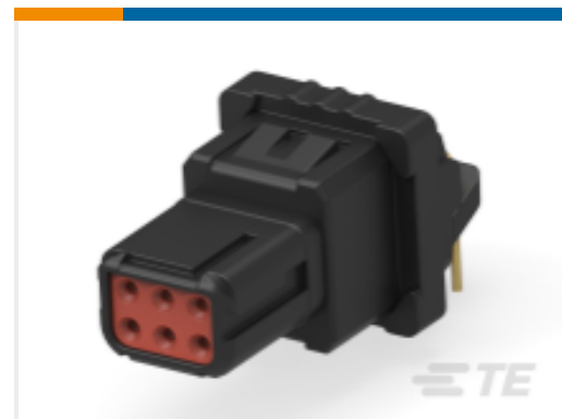
TE 产品编号YD369-B99-AP400000 Rectangular Connectors: 9-Way Panel Mount, 90PCB