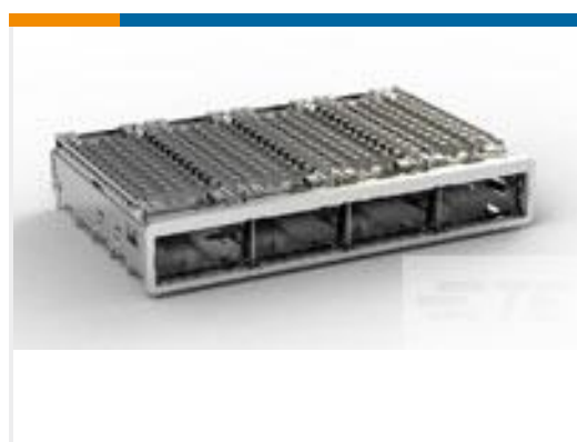
TE 产品编号 2007625-1 1x4 QSFP Kit Assy Bhnd Bzl, PCI