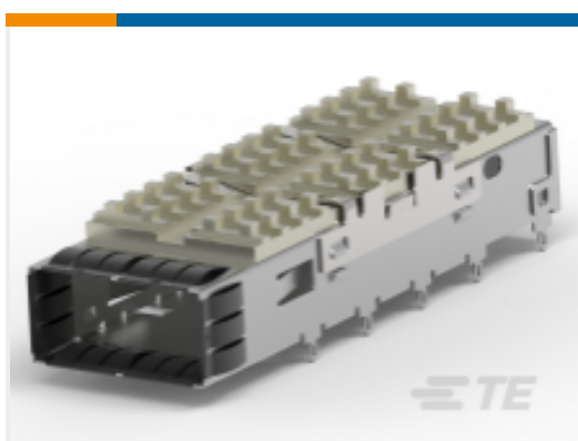
TE 产品编号 1888631-1 Cage Assy PCI Hsink QSFP Thru