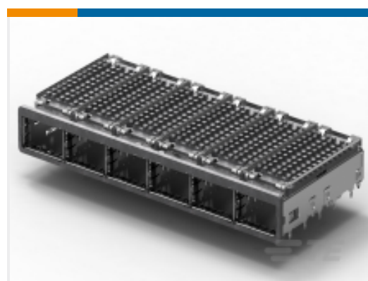
TE 产品编号 2143330-1 1X6 QSFP Kit Assy Bhnd Bzl, PCI