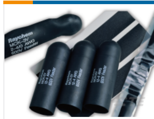
TE 产品编号 840744-000 MCK-2V