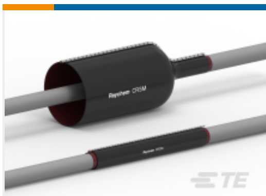
TE 产品编号002611-000 CRSM-143/36-1000/239(S1)