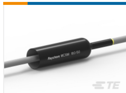
TE 产品编号CU4595-000 厚壁热缩管