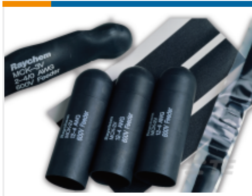
TE 产品编号 712836-000 MCK-3V