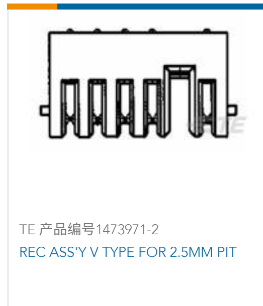
TE 产品编号1473971-2 REC ASS'Y V TYPE FOR 2.5MM PIT