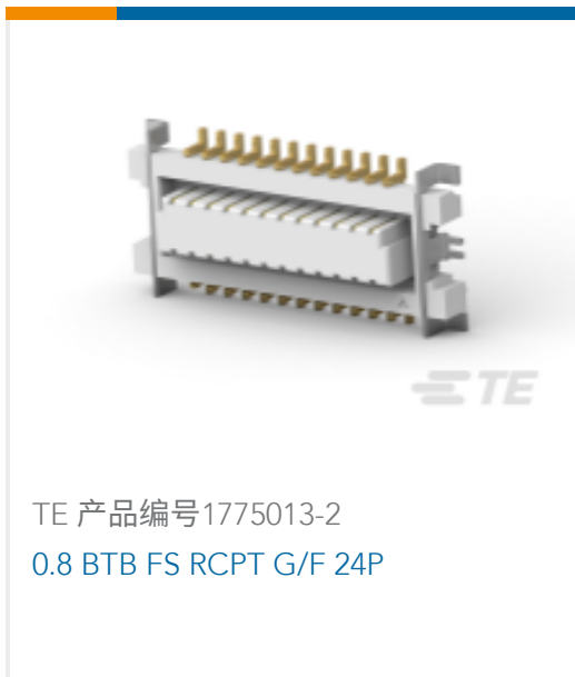
TE 产品编号1775013-2 0.8 BTB FS RCPT G/F 24P