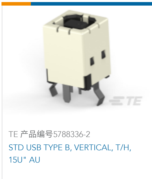
TE 产品编号5788336-2 STD USB TYPE B, VERTICAL, T/H, 15U" AU