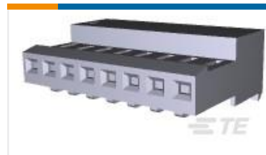
TE 产品编号3-640441-8 08P MTA100 CONN ASSY WHT