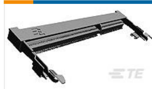
TE 产品编号2-2013297-1 EMBOSS TAPE DDR3 204P 8H STD