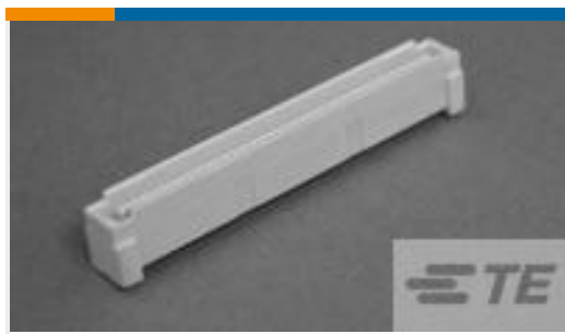
TE 产品编号5179031-1 0.8FH,P08H.5,040,08/Sn,TU