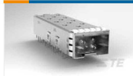
TE 产品编号2007194-1 SFP+ 1x1 Cage Assembly, PCI, Solder Tail