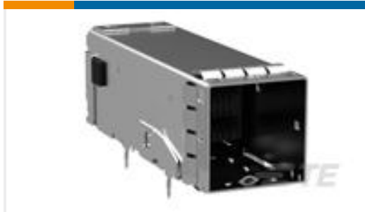
TE 产品编号2274215-1 MINISAS HD 1X1 REC ASSY