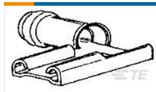
TE 产品编号156667-1 PIDG FASTON FLAG ASSY 22-18