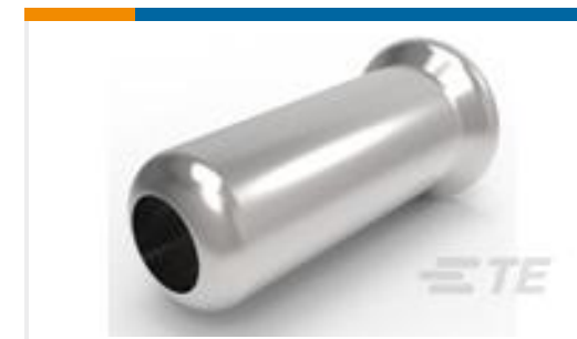
TE 产品编号5050865-3 SOCKET,MIN-SPR SN-AU SER-4