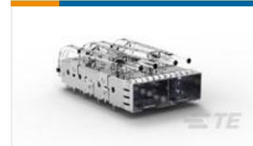
TE 产品编号2007262-1 SFP+ 1x2 Cage Assembly, Light