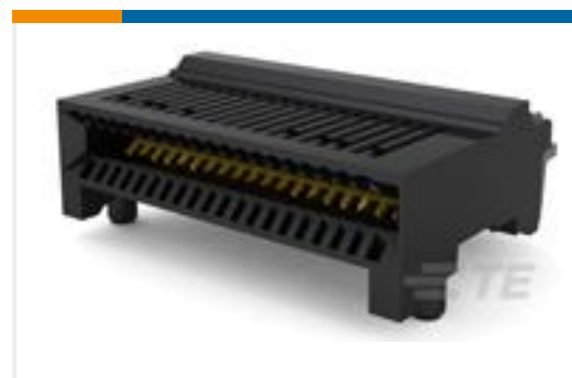
TE 产品编号1551920-2 zQSFP+ connector assembly