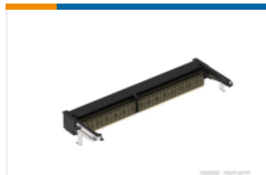
TE 产品编号2309413-1 DDR4 SODIMM 260P 9.2H STD