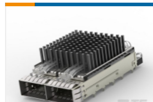
TE 产品编号2-2170808-3 QSFP28, 1X2, CAGE ASSY, SPRING, HS, LP