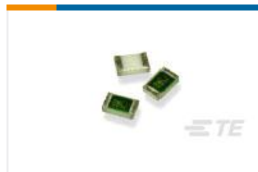
TE 产品编号3-1879208-6 CPF 0402 300R 0.1% 25PPM 1K RL