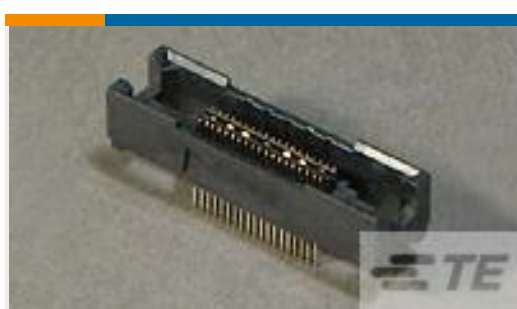
TE 产品编号5767044-1 MICTOR,R/A,RECPT,.062,038,ASY