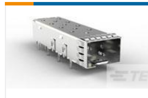
TE 产品编号2007198-1 SFP+ 1x1 Cage Assembly, Press-