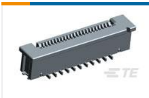
TE 产品编号2-1734742-4 .5 FPC VT ZIF Type-A 24 CONT