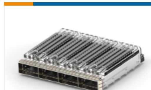
TE 产品编号5-2170790-4 CAGE ASSY, 1X4, QSFP28, SPRING, HS, LP