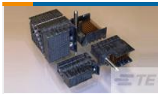
TE 产品编号2132423-1 IMP100O,R,RA3P6C,RG,39