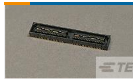
TE 产品编号6-1658043-2 MSB0.80RC-ASY080FL,GP,F,-TR