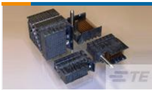
TE 产品编号2007850-1 IMP100S,H,V5P10C,UG,DEW46,4.5