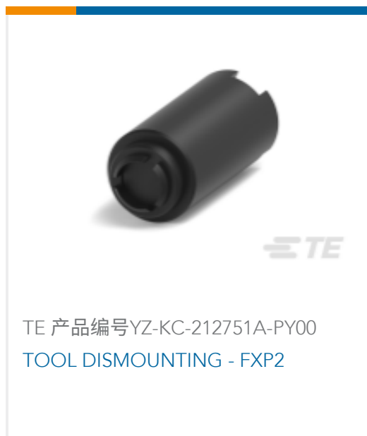
TE 产品编号YZ-KC-212751A-PY00 TOOL DISMOUNTING - FXP2