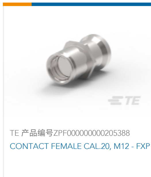
TE 产品编号ZPF000000000205388 CONTACT FEMALE CAL.20, M12 - FXP