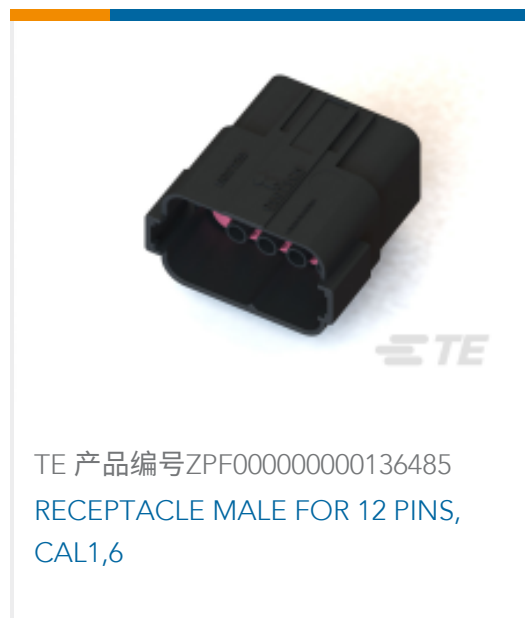
TE 产品编号ZPF000000000136485 RECEPTACLE MALE FOR 12 PINS, CAL1,6