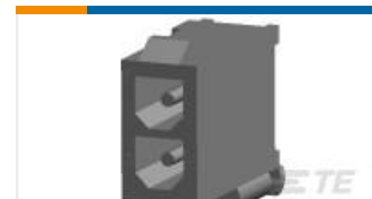
TE 产品编号1-770166-0 02P MINI-UMNL ASSY VO SNNI*