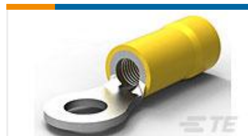
TE 产品编号34854 TERMINAL,PG R 12-10 10