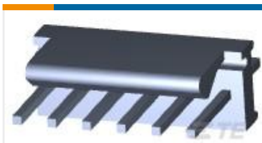
TE 产品编号640456-6 06P MTA100 HDR ASSY F/L SQ STR