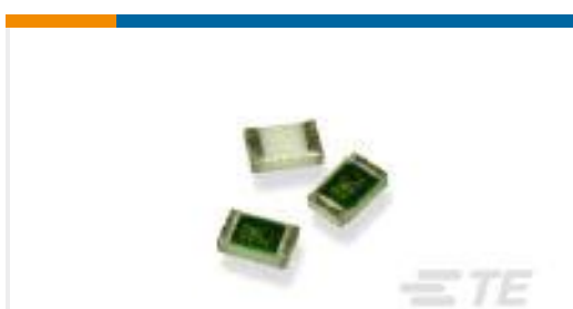
TE 产品编号1-1614885-9 CPF 0805 430K 0.1% 25PPM 1K RL