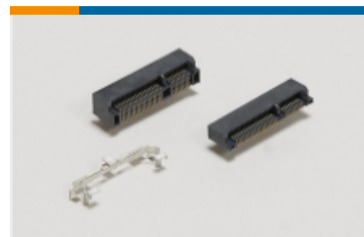
Mini PCI Express 和 mSATA(1)