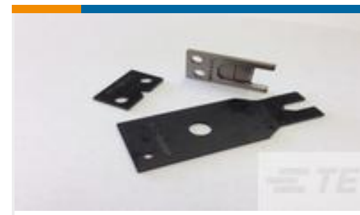
TE 产品编号9-240651-1 BLADE, SLUG