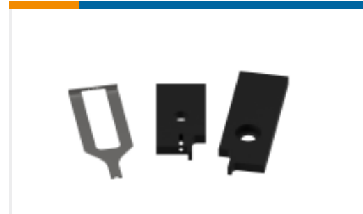
TE 产品编号2119791-5 Depressor, Wire