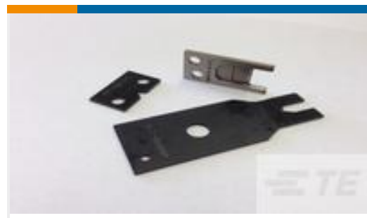
TE 产品编号1-690474-7 SHEAR BLADE