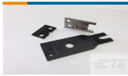
TE 产品编号2217206-5 Blade, Slug