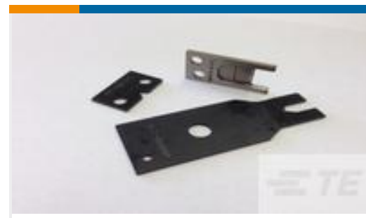
TE 产品编号1-2217206-2 Blade, Slug