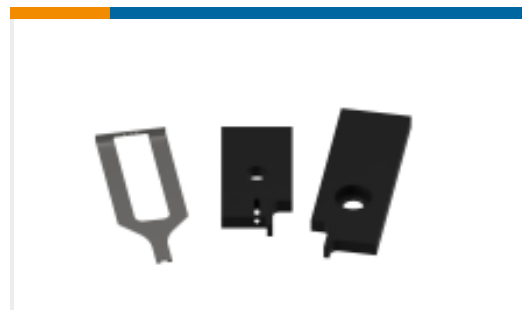
TE 产品编号2119791-6 Depressor, Wire