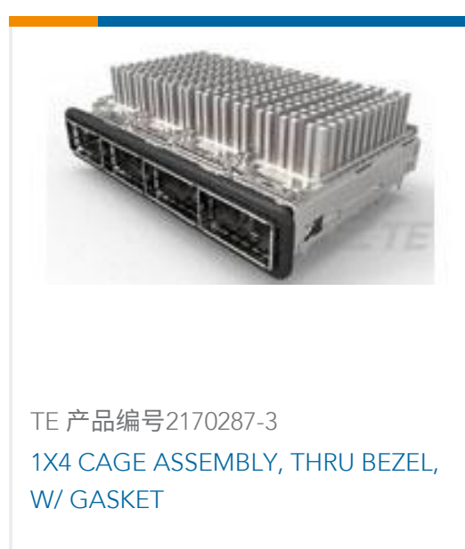
TE 产品编号2170287-3 1X4 CAGE ASSEMBLY, THRU BEZEL, W/ GASKET