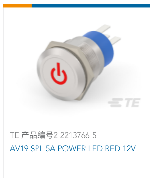
TE 产品编号2-2213766-5 AV19 SPL 5A POWER LED RED 12V