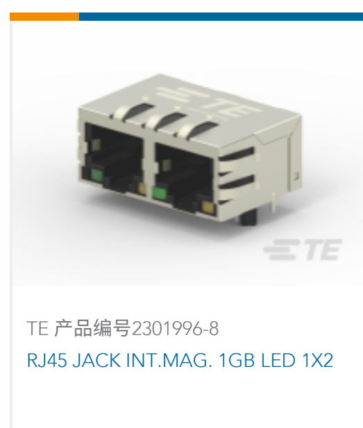
TE 产品编号2301996-8 RJ45 JACK INT.MAG. 1GB LED 1X2