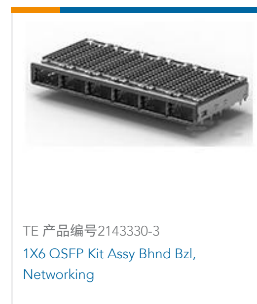
TE 产品编号2143330-3 1X6 QSFP Kit Assy Bhnd Bzl, Networking