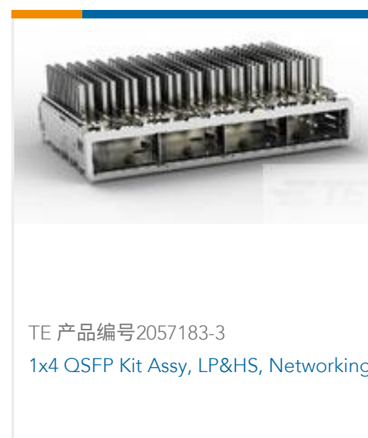
TE 产品编号2057183-3 1x4 QSFP Kit Assy, LP&HS, Networking