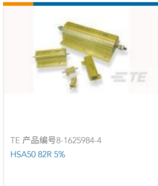
TE 产品编号8-1625984-4 HSA50 82R 5%