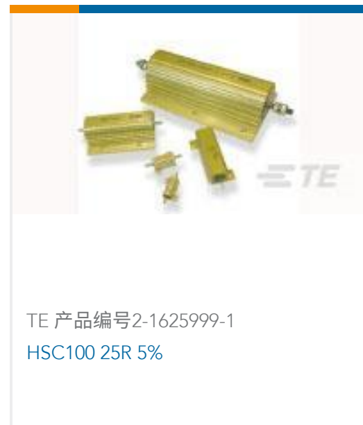
TE 产品编号2-1625999-1 HSC100 25R 5%