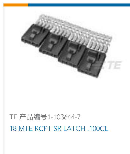
TE 产品编号1-103644-7 18 MTE RCPT SR LATCH .100CL