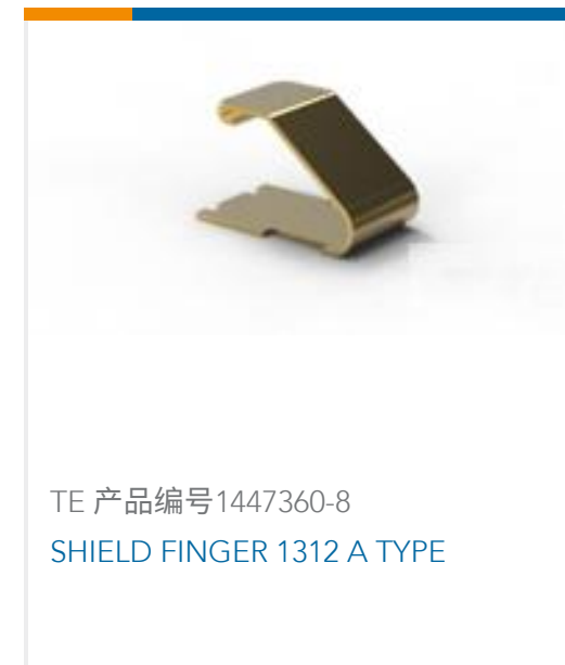
TE 产品编号1447360-8 SHIELD FINGER 1312 A TYPE