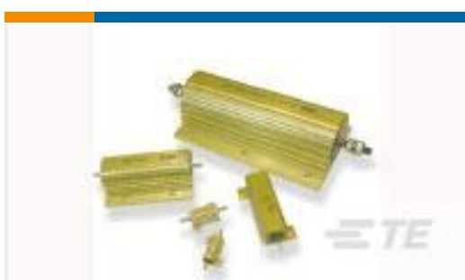
TE 产品编号7-1625966-3 HSA10 56R 5%