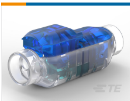
TE 产品编号 2213800-4 COOLSPICE NEW STANDARD