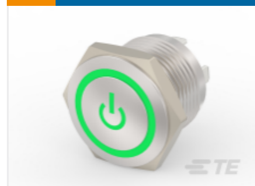
TE 产品编号 2213775-7 AV16 SPM 0.4VA POWER LED GREEN 12V