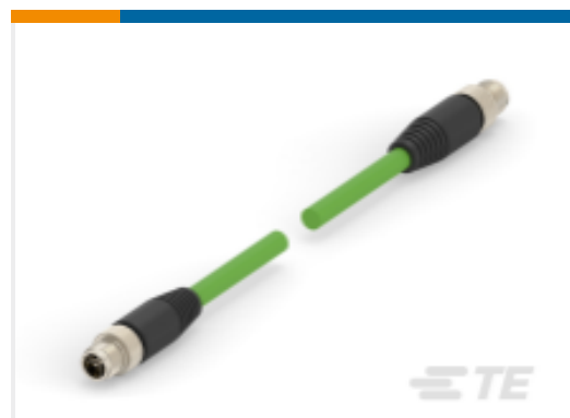
TE 产品编号TAX38721112-002 RPC-M12X-8MS-1.0SH-M12X-8MS-PVC