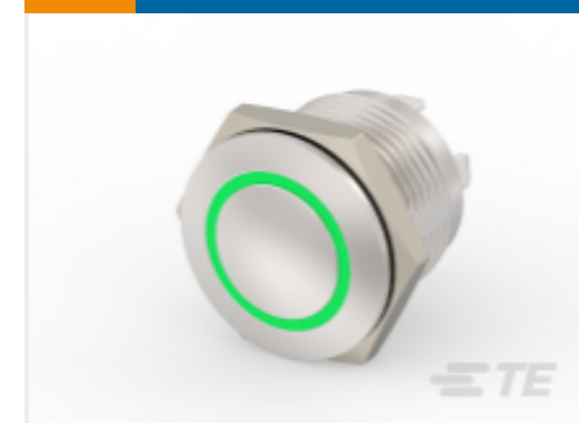
TE 产品编号 2213774-7 AV16 SPM 0.4VA FIX RING LED GREEN 12V