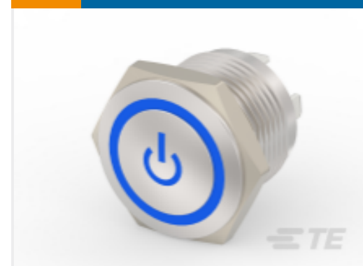
TE 产品编号 2213775-9 AV16 SPM 0.4VA POWER LED BLUE 12V