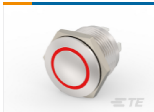
TE 产品编号 2213774-3 AV16 SPM 0.4VA FIX RING LED RED 12V