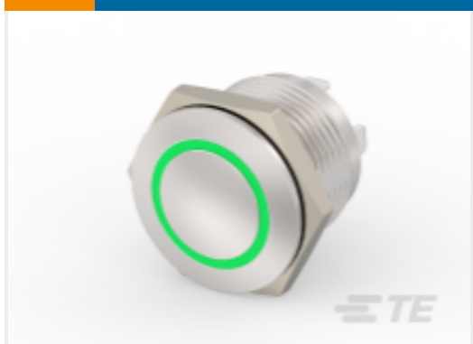
TE 产品编号 2213774-7 AV16 SPM 0.4VA FIX RING LED GREEN 12V