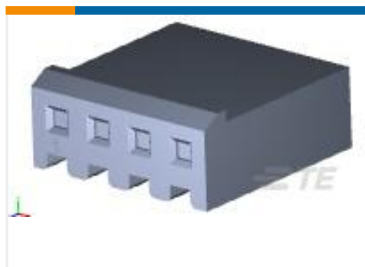
TE 产品编号647401-4 04P SL156 HSG W/RAMP,LRG OPEN