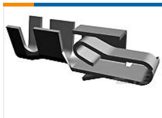
TE 产品编号647485-2 SL156 RECEPT,AUNI/PHBZ,L/P,LRG