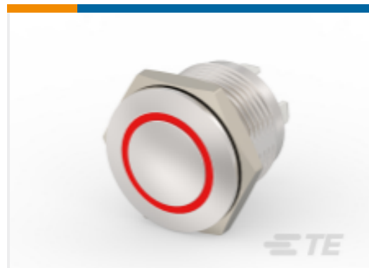
TE 产品编号 2213774-3 AV16 SPM 0.4VA FIX RING LED RED 12V